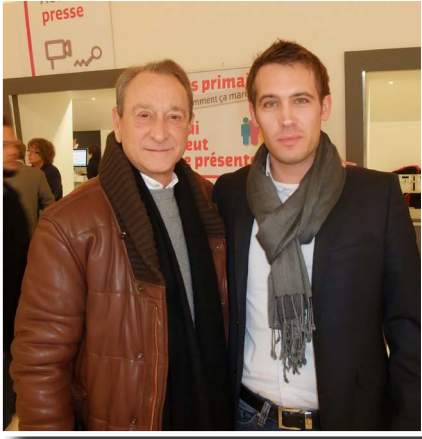
Bertrand Delanoë Maire de Paris